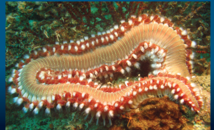
Verme de fogo ( Hermodice carunculata )