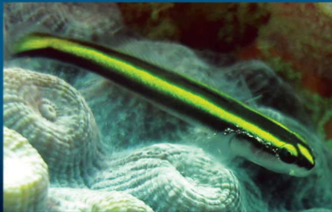
Peixe neon ( Elacatinus sp.)